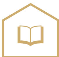
SZKOŁA PODSTAWOWA 8 LAT

Po ukończeniu szkoły podstawowej możesz uczyć się w jednej ze szkół dla fotografów: