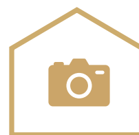
SZKOŁA DLA FOTOGRAFÓW