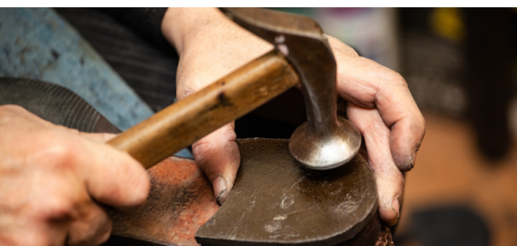
MŁOTKA DO WBIJANIA NP. GWOŹ- DZI I FLEKÓW DO OBCASÓW