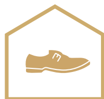
SZKOŁA DLA SZEWCÓW