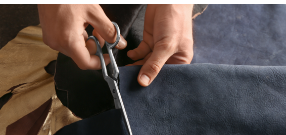
NOŻYCZKI DO CIĘCIA MATERIAŁU (podczas wytwarzania lub naprawy obuwia.)