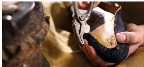
CĘGI SZEWSKIE (do naciągania i przetrzymywania materiału, skóry.)