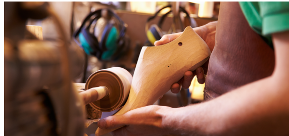
KOPYTKO SZEWSKIE DO FORMOWANIA OBUWIA