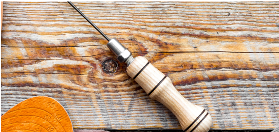
IGIEŁ SZEWSKICH DO SZYCIA BUTÓW