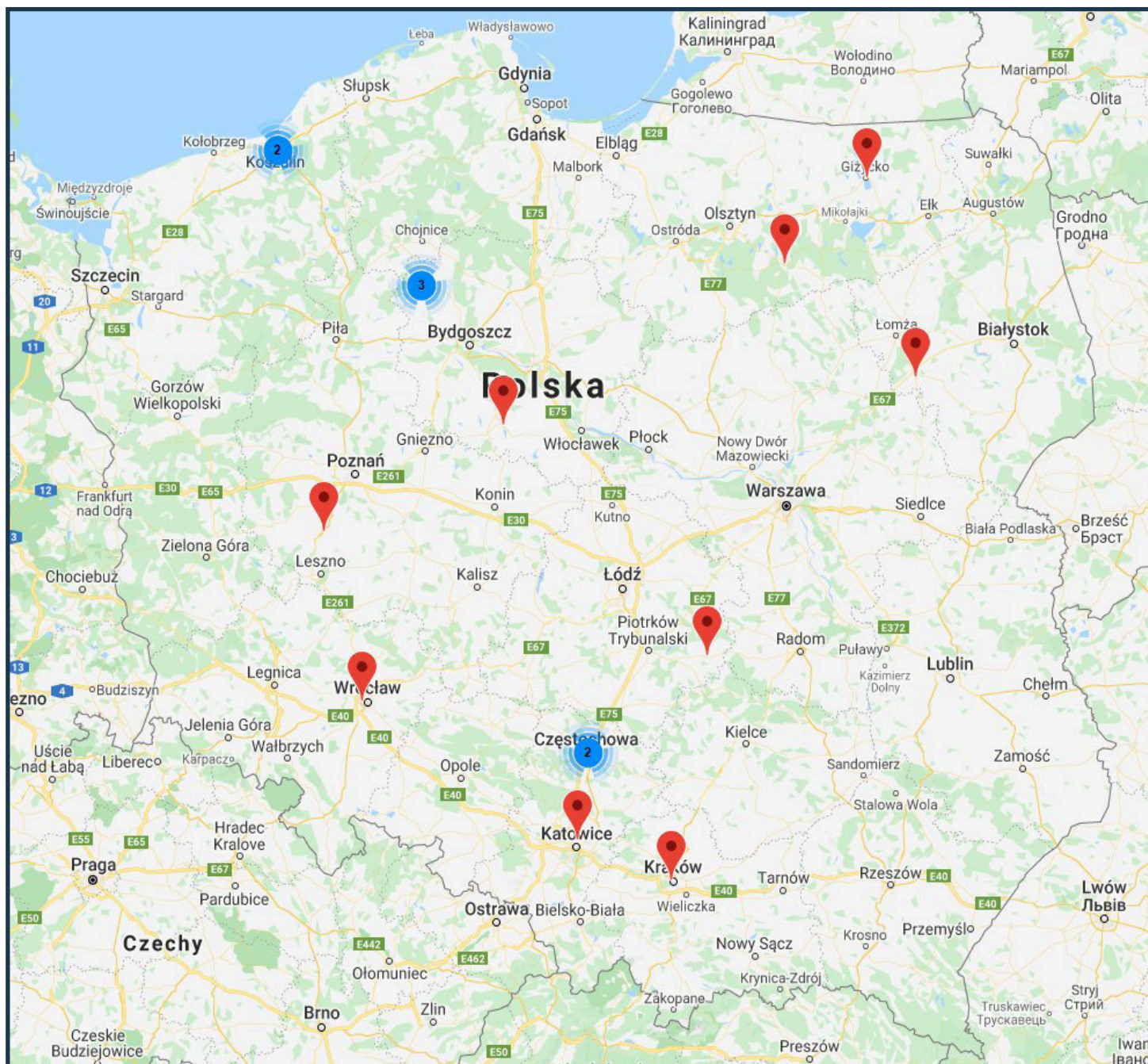
Orientacyjna mapa szkół prowadzących kształcenie w zawodzie PRACOWNIK POMOCNICZY KRAWCA w roku szkolnym 2020/2021