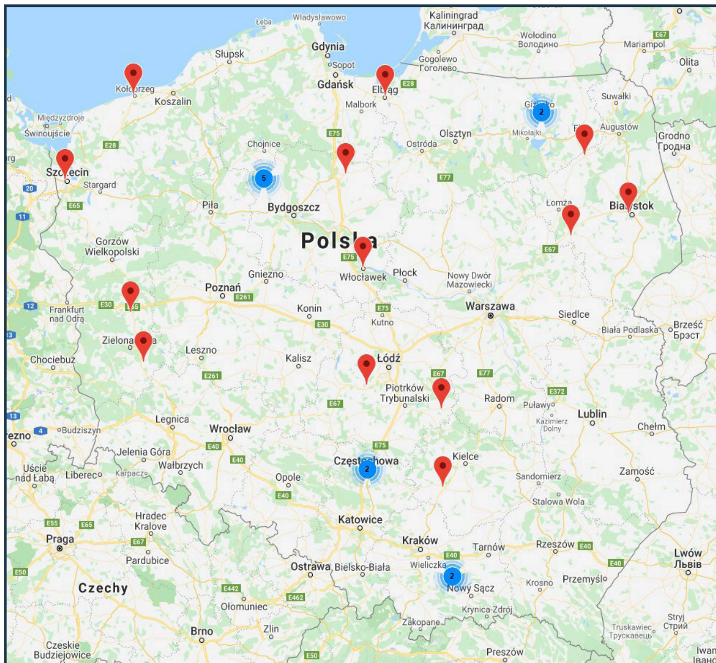
Orientacyjna mapa szkół prowadzących kształcenie w zawodzie PRACOWNIK POMOCNICZY STOLARZA w roku szkolnym 2020/2021